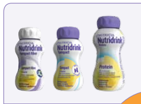
Drinkvoeding voor een specifieke behoefte

Het is belangrijk dat u elke dag de aanbevolen hoeveelheid drinkvoeding opdrinkt om te zorgen dat uw dieetbehandeling succes heeft. Variëren tussen verschillende smaken en soorten drinkvoeding kan u hierbij helpen. Daarom is Nutridrink verkrijgbaar in verschillende varianten. Zo zijn er naast Nutridrink Compact, Nutridrink Compact Fibre en Nutridrink welke op melkbasis zijn, ook Nutridrink varianten op yoghurt basis (Nutridrink Yoghurt Style) en met een frisse fruitige smaak (Nutridrink Juice Style). Daarnaast is er ook drinkvoeding verkrijgbaar in de vorm van toetjes en soep.